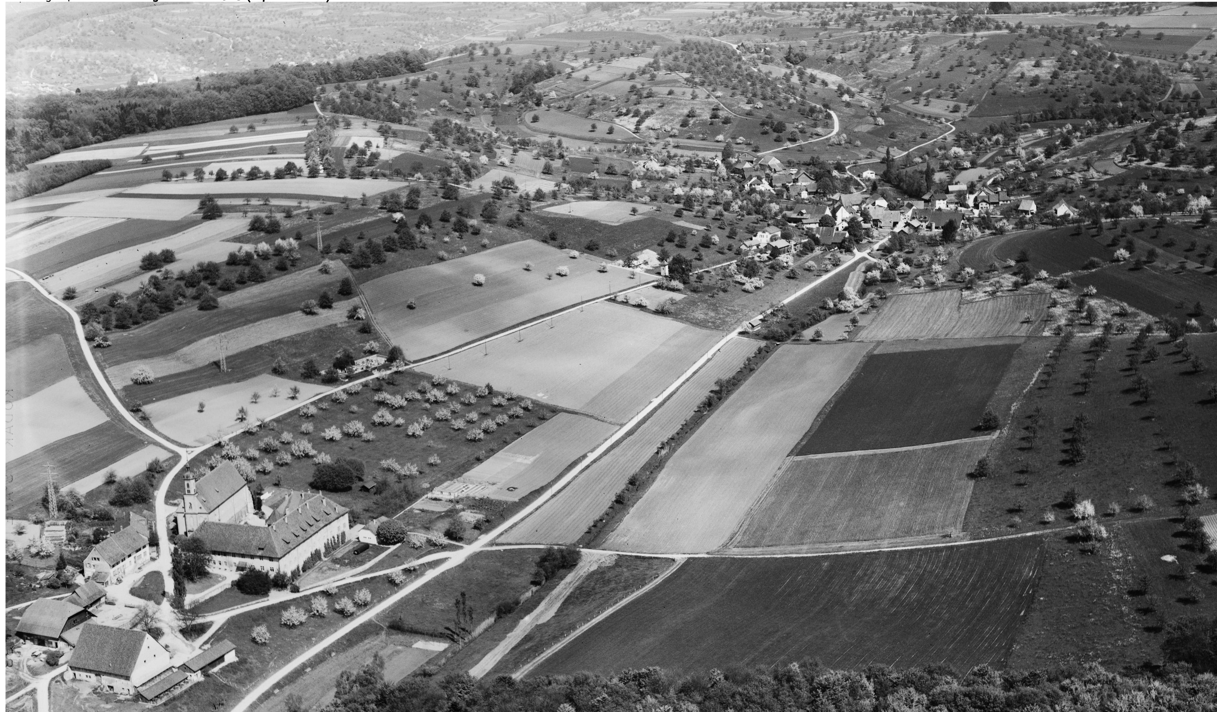
Olsberg in der Landschaft des Tafeljuras. Im Vordergrund der Stift Olsberg ist deutlich abgesetzt vom Dorf. Das Dorf hatte seinen Ursprung in einem Meierhof um den sich mit der Zeit weitere Höfe ansiedelten.