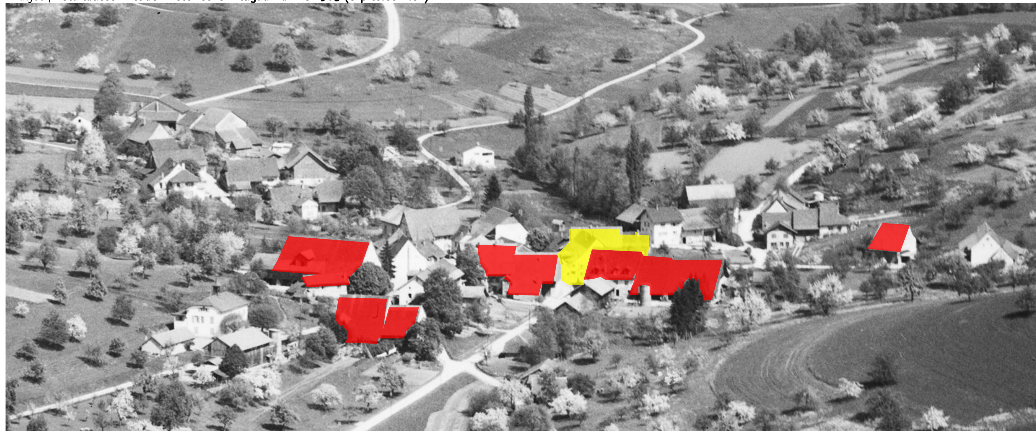
Historische Torsituation mit tief heruntergezogenen Dächern (rot) und die kurze Zeit später abgebrochene Gebäudegruppe im Zentrum Olsbergs (gelb)